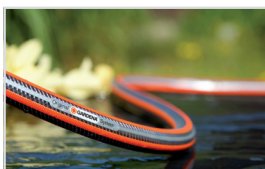
SPIRALMESH-TEKSTIL AV HØY KVALITET