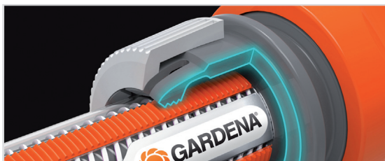
MED POWER GRIP-PROFIL