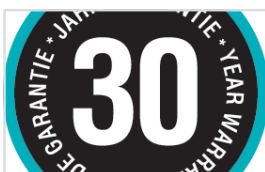
HØY KVALITET FOR LANG VARIGHET